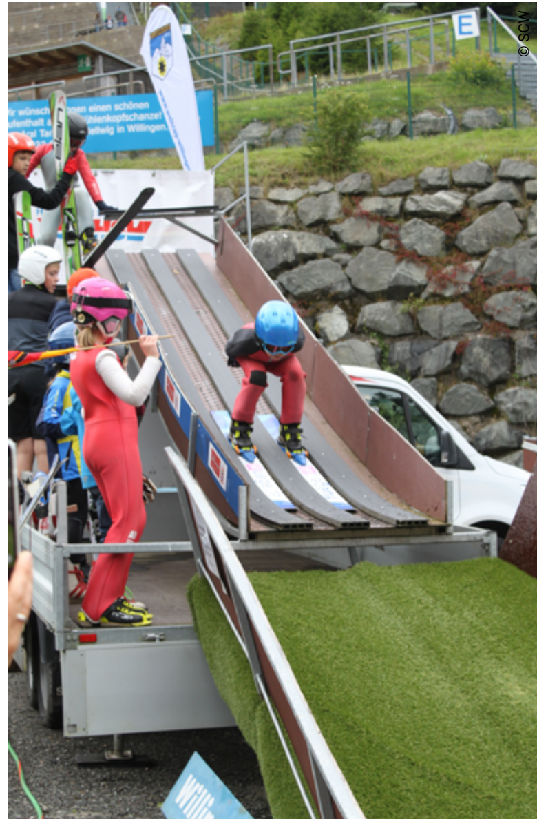
Minischanze Nordic Day

Blieb vor der heißen Phase des Weltcup-Countdowns und dem Start in den neuen Winter die