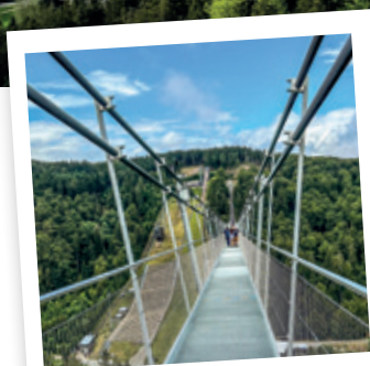
Trau dich frei zu sein