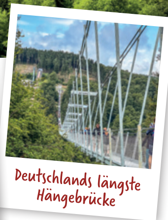
Deutschlands längste Hängebrücke

Auf beeindruckenden 665 Metern Länge führt das Bauwerk von der international bekannten Mühlenkopfschanze über den Willinger Ortsteil Stryck hinweg bis zum Musenberg.